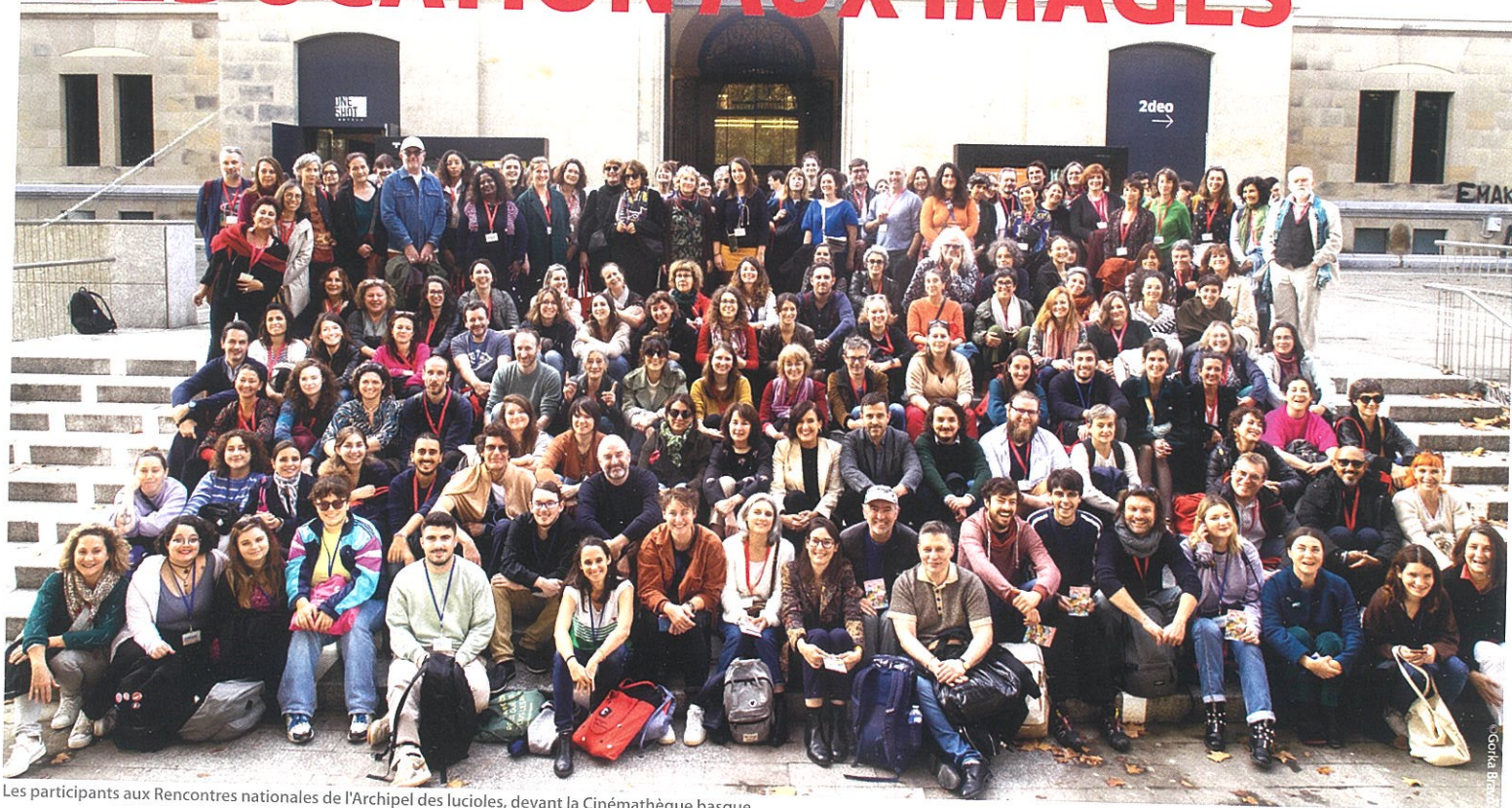
Les participants aux Rencontres nationales de l'Archipel des lucioles, devant la Cinémathèque basque

Alors que les récentes directives de l'Éducation nationale fragilisent les dispositifs de Ma classe au cinéma, les acteurs de terrain sont plus que jamais mobilisés pour les défendre. Ils l'ont exprimé, aux côtés du CNC, lors des Rencontres organisées par l'Archipel des lucioles au Pays basque, qui ont aussi montré que le travail mené localement peut avoir une portée internationale.