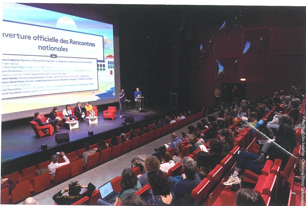
Élus locaux, représentants de l'Éducation nationale et du CNC, ont ouvert les débats des ces Rencontres, aux côtés des coordinateurs régionaux des dispositifs

tous les enseignants et médiateurs, aux formations et ressources nécessaires, pour que l'accompagnement des enfants et des jeunes puisse se faire toujours avec le même niveau d'exigence et de qualité ». Et d'ajouter que « le CNC est à vos côtés sur l'ensemble de ces sujets ».