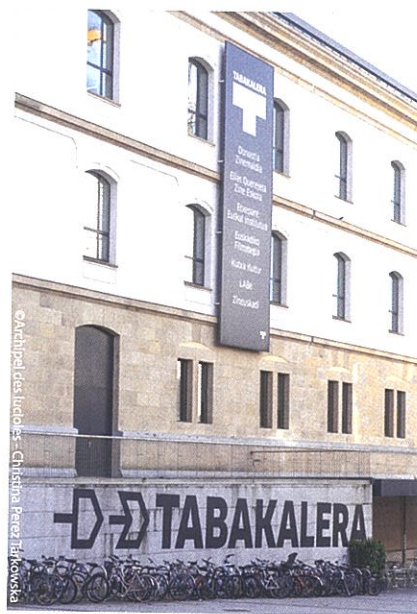
Archipel des lucioles - Ch. Serna Pérez / R. Kovács

Ouvert en 2015 dans l'ancienne manufacture de tabac de San Sebastián, le centre culturel contemporain Tabakalera abrite notamment l'importante Cinémathèque basque, membre de la Fédération internationale des archives du film (FIAF), et le festival international du film de San Sebastián. C'est aussi le siège d'une école de cinéma, la Elías Querejeta Zine Eskola (du nom du grand producteur), unique en Espagne car formant aussi à la conservation et à la programmation, en lien avec les ressources et les professionnels de la cinémathèque et du festival.